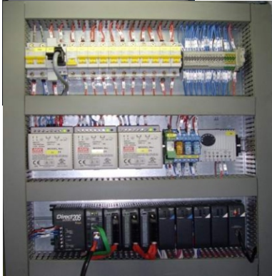
САУ котлом ДЕВ 25/14 ГМ г. Муравленко